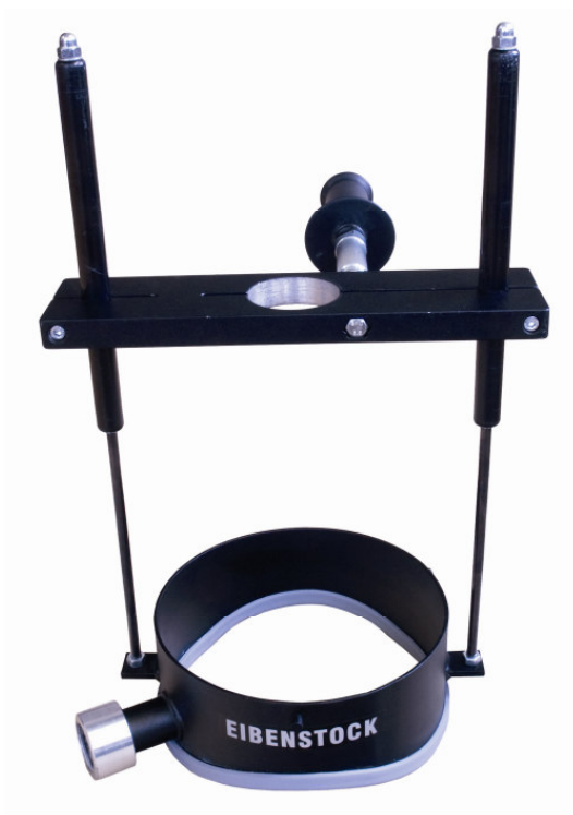
Rohrbohrständer RBS 200